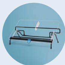
R-Go Flex Read